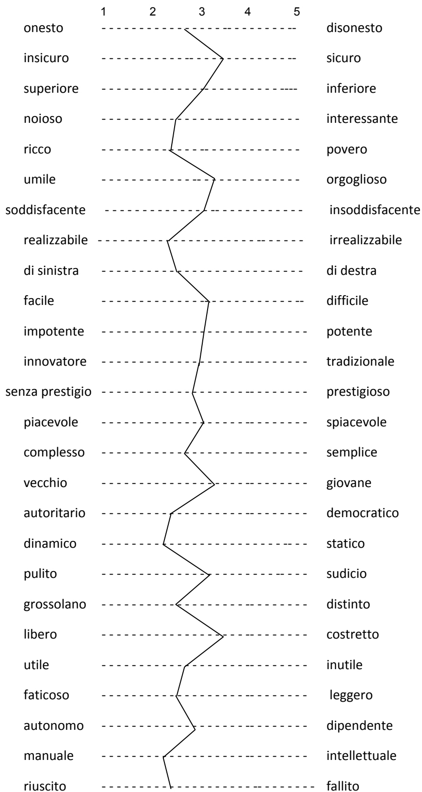
Graf. 1 – Valutazione del cinese secondo l'intero campione: Rappr. grafica dei punteggi medi