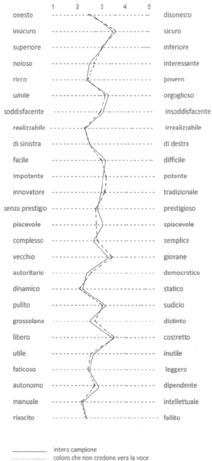
Graf. 3 – Valutazione del cinese secondo coloro che non credono vera la voce (punteggi medi)