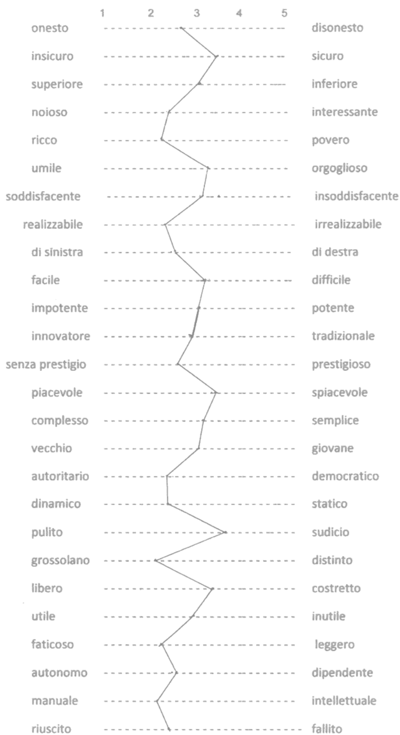
Graf.6 – Valutazione del cinese secondo coloro che non credono vera la voce: sottocampione “prudenza verificatrice” (punteggi medi)