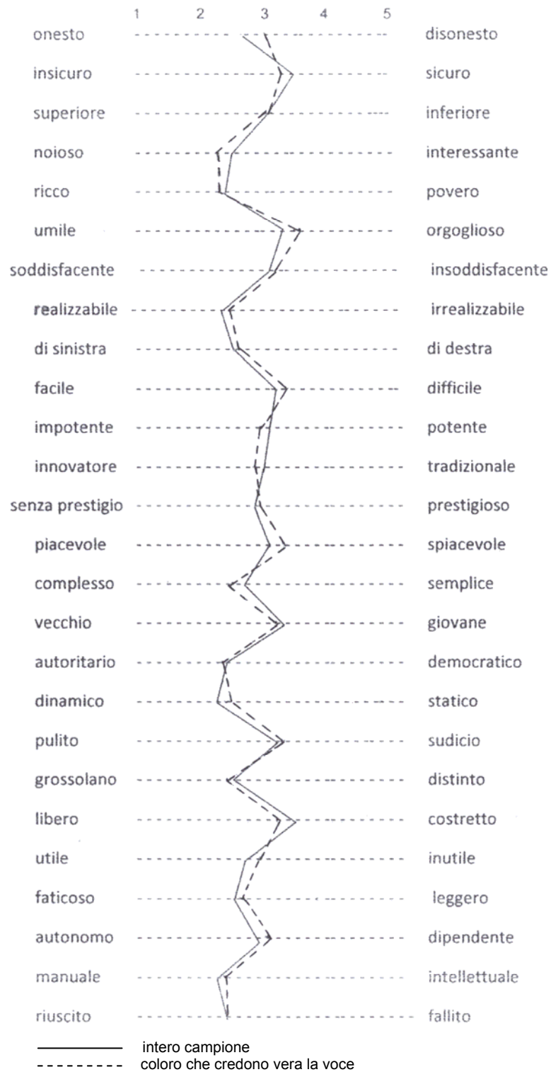
Graf. 2 – Valutazione del cinese secondo coloro che credono vera la voce (punteggi medi)