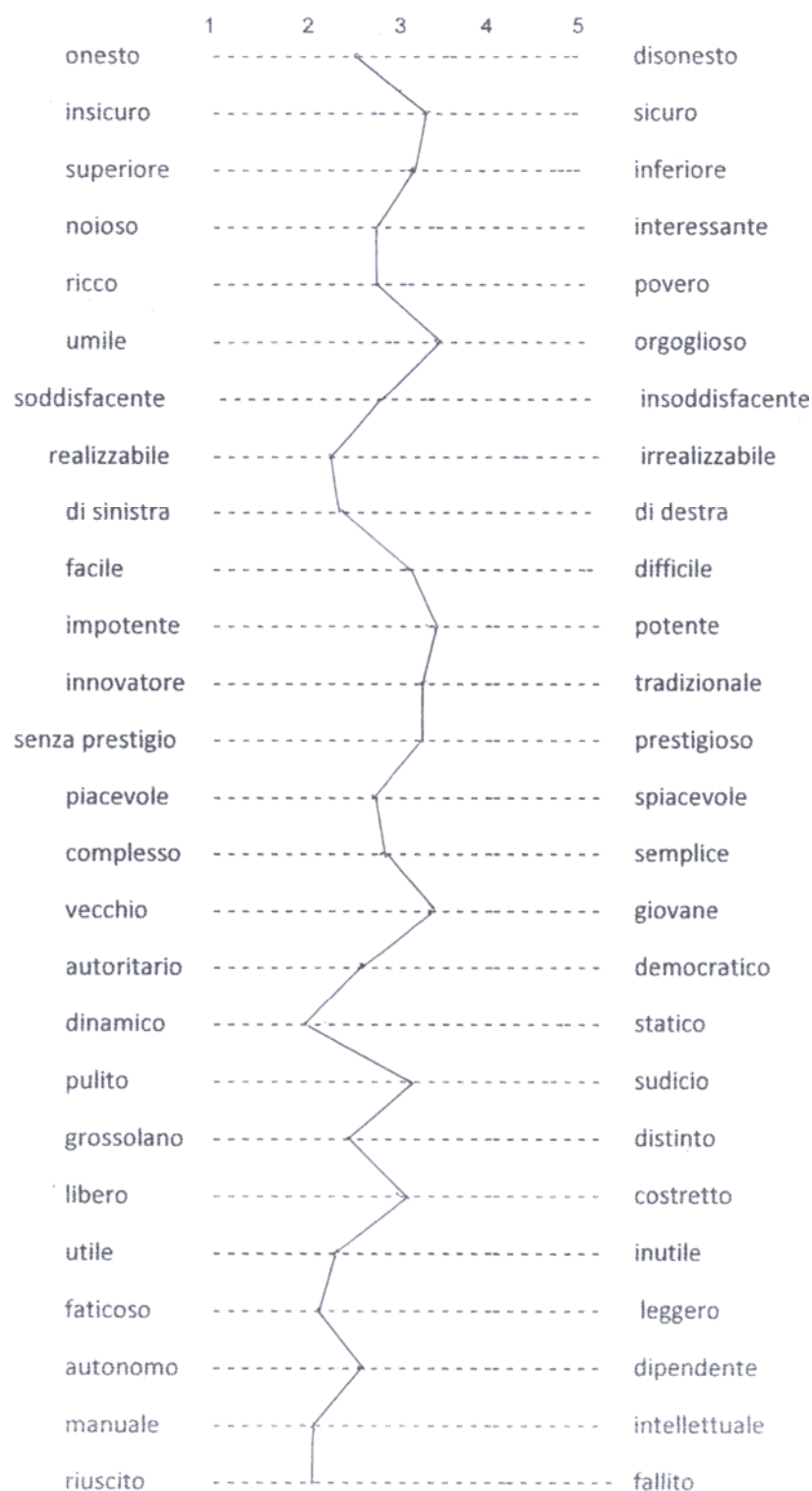
Graf.4 – Valutazione del cinese secondo coloro che non credono vera la voce: sottocampione “relazione immaginaria” (punteggi medi)