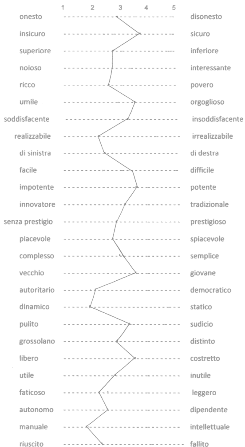
Graf.7 – Valutazione del cinese secondo coloro che non credono vera la voce: sottocampione “chi accusa e condanna” (punteggi medi)